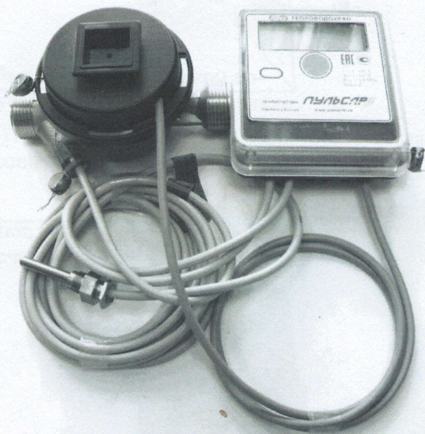
б) модификаций "Пульсар" Т