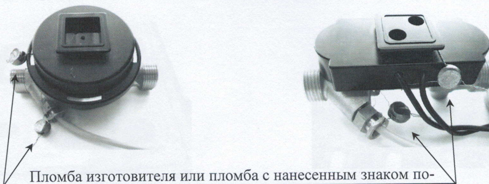
Схема пломбировки теплосчетчиков представлена на рисунке 2.

Пломба изготовителя или пломба с нанесенным знаком поверки или пломба организации, установившей теплосчетчик