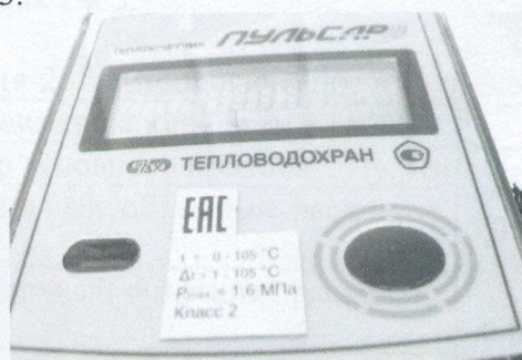
а) вид спереди

Маркировка вычислителей теплосчетчиков модификаций "Пульсар" К приведена на рисунке 3.