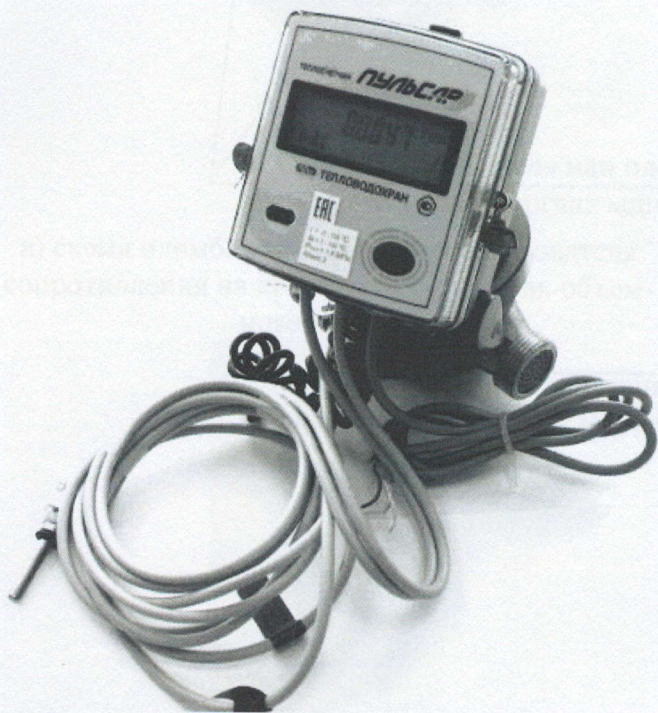
а) модификаций "Пульсар" К

Общий вид теплосчетчиков показан на рисунке 1.