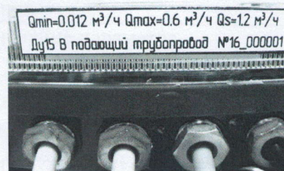
б) вид снизу