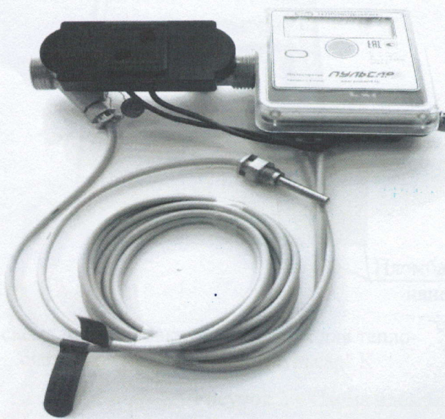
в) модификаций "Пульсар" У