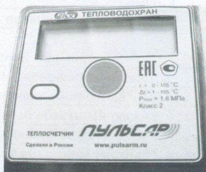
а) вид спереди

Маркировка вычислителей теплосчетчиков модификаций "Пульсар" Т, "Пульсар" У и "Пульсар" УД приведена на рисунке 4.